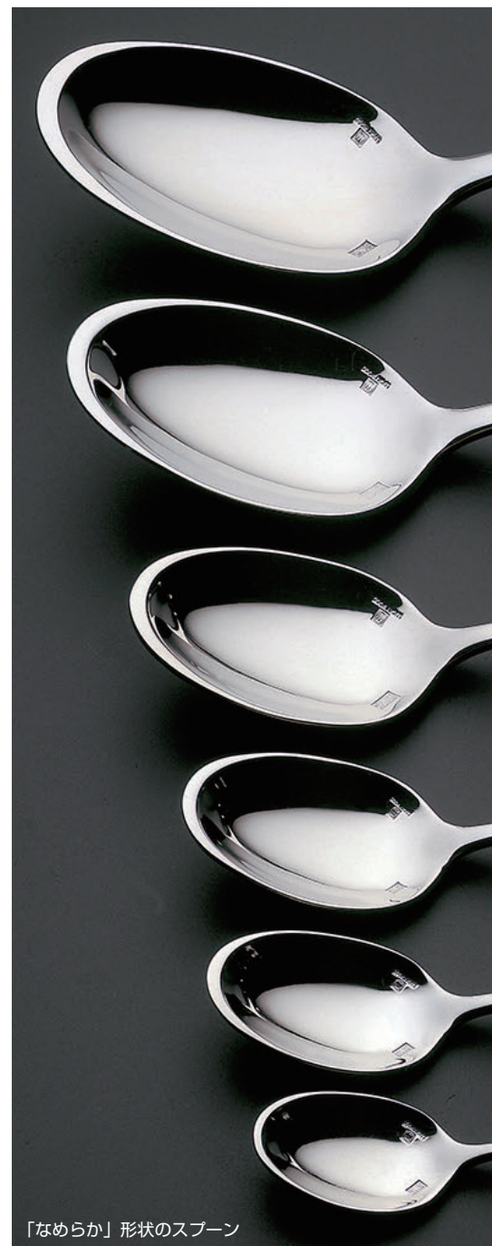
「なめらか」形状のスプーン

* ナイフには刃物用の特殊なステンレス素材が使用されています。 * デザートナイフは刃部が「鋸刃なし」と「鋸刃」の2種類ございます。